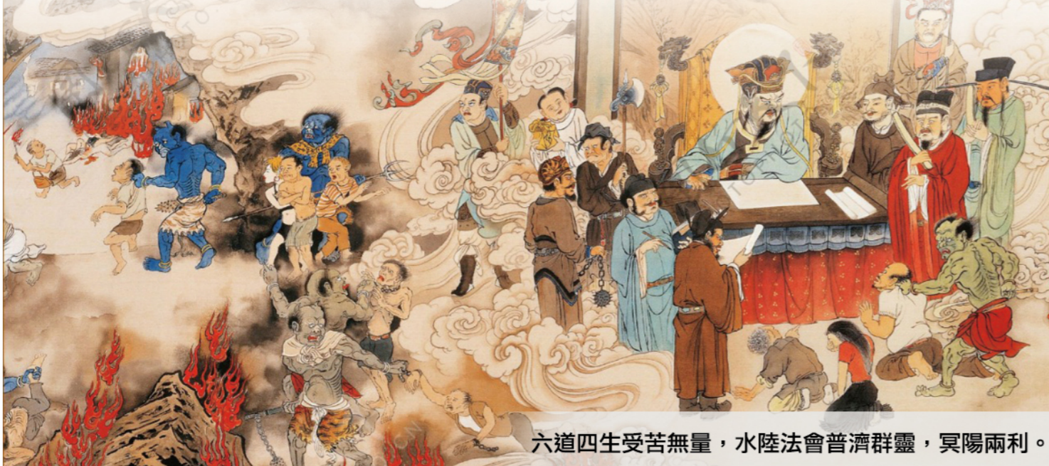
六道四生受苦無量，水陸法會普濟群靈，冥陽兩利。

開山住持聖化師父慈悲開示大眾：「寺院道場除了讓我們參與法會共修之外，更是一所學院，教育我們看清娑婆世界是一個還債台。我們凡夫眾生因為執著、分別心，身口意行不平等，產生了種種業障，唯有廣大心胸，才能容納萬福。如果能將這顆心轉化為佛心，凡事感恩，才能減少怨親之別。啟建水陸法會除了自利，更重要的是利他，只要我們至誠發心，用心修一切善法，我們的累世父母六親眷屬、累世冤親，乃至十方世界眾生都能因而得到我們的功德回向。世間上沒有任何人能夠主宰我們的因果，唯獨我們自己才能掌握自己的禍福賞罰，我們的心對我們所造的一切善惡業有所責任。要怎麼修這顆心？學習諸佛菩薩的慈悲喜捨，諸惡莫作，眾善奉行，西方的法船隨時都準備好在等著我們。」